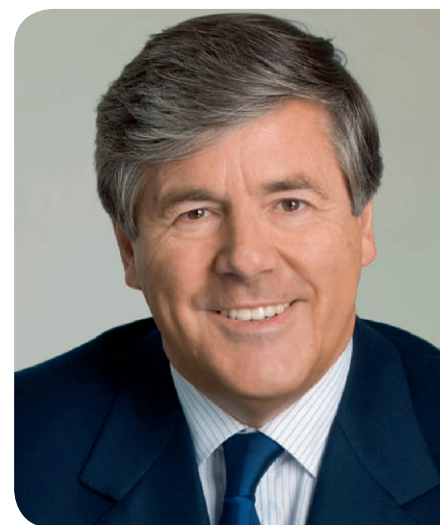
Josef Ackermann, Vorsitzender des Vorstands der Deutsche Bank AG.

All business is local. Auch in einer globalen Welt. Universitäten und Forschungsinstitute müssen sich etwa bei der Suche nach qualifizierten Wissenschaftlern auch über ihre Region definieren. Sie müssen diesen Menschen und ihren Familien ein attraktives Zuhause bieten. Wenn dieses das Namensschild „Stadt der Wissenschaft“ trägt, ist es viel leichter, begabte und engagierte Wissenschaftler zu gewinnen, weil diese wissen: Wir treffen dort auf ein anregendes Umfeld.